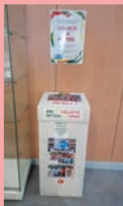
Borne de collecte au club-house