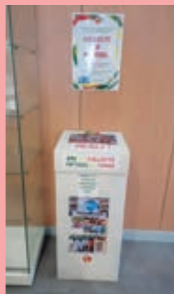
Borne de collecte au club-house